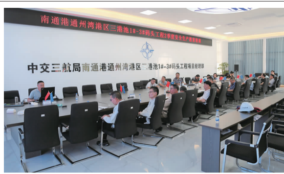
为扎实推进“安全生产月”宣传教育工作，建投公司在三航局项目部组织开展2022年第二季度安全教育培训。