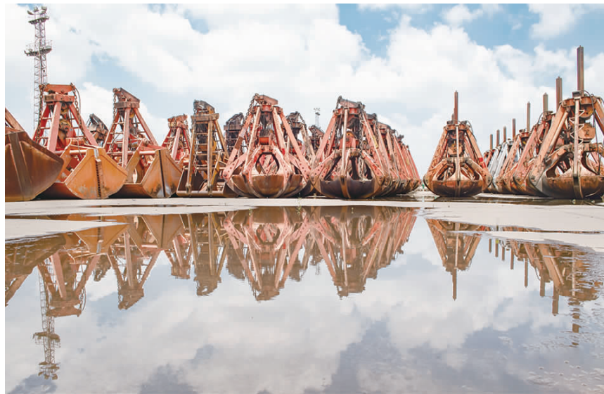
图为通州港务分公司抓斗处置场地。