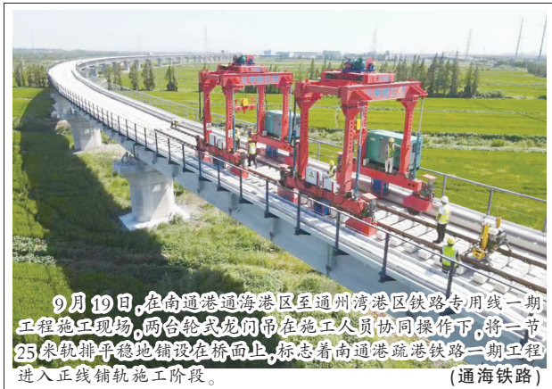
9月10日,在南通港通州港区至通州湾港区铁路专用线一期工程施工现场,两台轮式龙门吊在施工人员协同操作下,将一节25米轨排平稳地铺设在桥面上,标志着南通港疏港铁路一期工程进入正线铺轨施工阶段。(通海铁路)