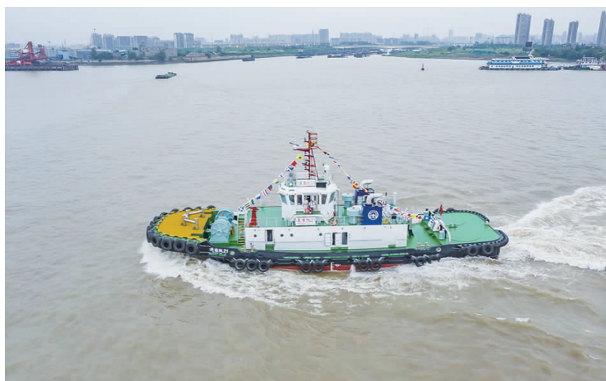
图为“通港拖21”轮在通海港区作业

通过学习《习近平谈治国理政》第四卷,我深刻感受到习近平新时代中国特色社会主义思想的巨大伟力,也深刻领悟到作为长江南通段重要的船舶服务企业,站在“两个百年”历史交汇、“两个大局”激荡交织的关键节点,要在大局大势中找准目