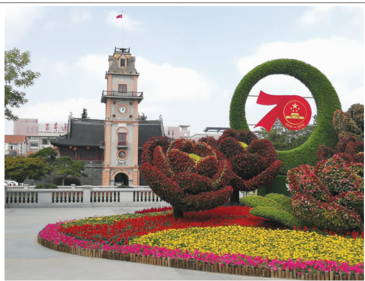
为祖国庆生